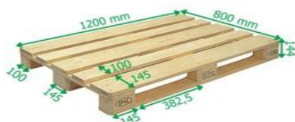
EURO paleta 1200 x 800 mm