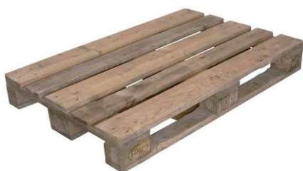
použitá EURO paleta

S účinností od roku 2022 není rozlišováno paleta EURO nová/použitá. Při vrácení EURO palet tedy není na straně Arkys, s.r.o. určován storno poplatek za účelem stanovení stupně opotřebení vrácených obalů.