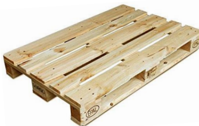
nová EURO paleta